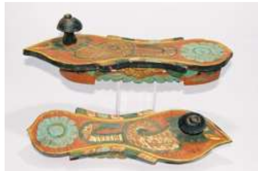
(لوحة ٢٨) بادوكا من الخشب مزخرفة بزخارف منحوتة ومطلية بالألوان، تنسب إلي إندونيسيا أوائل القرن (١٤هـ / ٢٠م) محفوظ بمتحف (shoes or no shoes)

https://www.michaelbackmanltd.com/archive_d_objects/paduka-sandals-india/