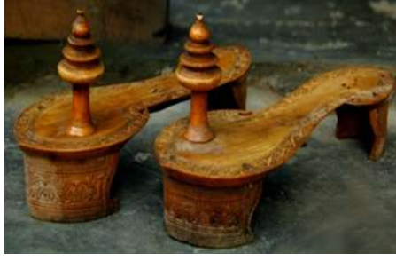
(لوحة ٣٠) بادوكا خشبية تنسب إلى الهند، ومن المرجح نسبه هذه البادوكا إلى القرن (١٣-١٤هـ/١٩-٢٠م)