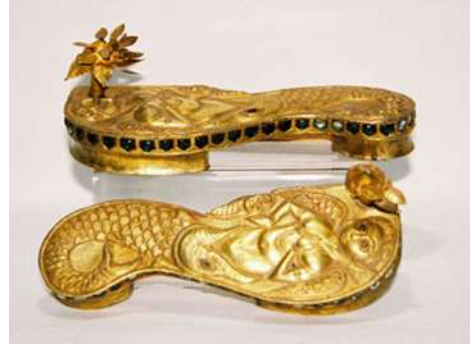
(لوحة ١٢) بادوكا خشبية مكفتة بالذهب ومرصعة بالأحجار الكريمة تنسب إلى الهند أواخر القرن (١٣هـ/ ١٩م) محفوظة بمتحف (shoes or no shoes) رقم الحفظ ١٣٦٥

https://www.michaelbackmanltd.com/object/pair-of-silver-paduka-sandals/