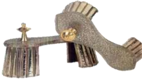
(لوحة ١٤-١٥) زوج من البادوكا الفضي، نو مقبض علي هيئة الصينية مذهب، ويعود إلى جايبور بالهند، القرن (١٢هـ/١٨م) ومحفوظ في متحف باتا.

ALEXANDER MCLVER, J., & COLLINS, W., All about Shoes, 27. JaiN-NEUBAUER, J., & Footwear in Indian Culture, 6.