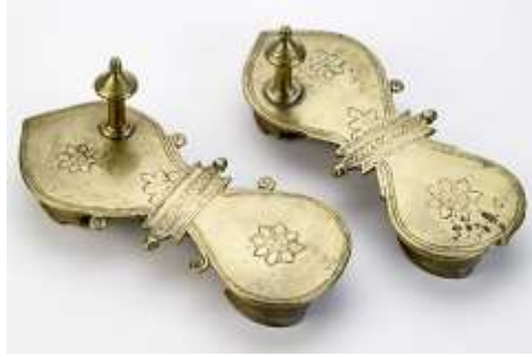
(لوحة ١٨) بادوكا مصنوعة من النحاس تنسب إلى القرن (١٤هـ / ٢٠م) محفوظة في متحف باتا