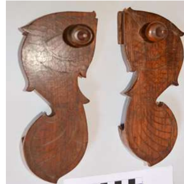
(لوحة ٢٢) بادوكا خشبية علي شكل سمكة، يرجح نسبتها إلى الهند أو البنغال في القرن (١٣هـ / ١٩م)، وهي محفوظة بمتحف جاير أندرسون بالقاهرة، رقم الحفظ ١٧٠٠