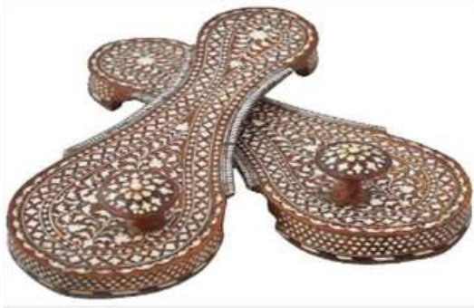
(لوحة ٢٧) بادوكا خشبية مرصعة بالعظم والعاج تنسب إلي هوشياپور، شمال الهند حوالي عام (١٨٥٠م) محفوظ في متحف (Michael Backman ltd)، مزخرفة بزخارف نباتية وهندسية تنسب للقرن (١٣هـ / ١٩م)

https://www.chiswickauctions.co.uk/auction/lot/lot-196--a-pair-of-brass-inlaid-toe-knob-wooden-paduka-sandals/?lot=123351&so=4&st=paduka&sto=0&au=&ef=&et=&ic=False&sd=1&pp=48&pn=1&g=1