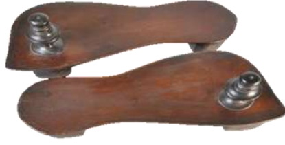
(لوحة ١) بادوكا خشبية خالية من الزخرفة والتطعيم تنسب إلي الهند في القرن (١٣هـ / ١٩م).

https://www.michaelbackmanltd.com/object/pair-of-carved-wooden-paduka-shoes