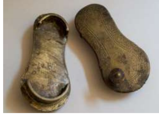
(لوحة ١٩) بادوكا من معدن النحاس الأصفر محفوظة في متحف جاير أندرسون بالقاهرة يرجح نسبتها إلى الهند في فترة القرن (١٣هـ / ١٩م) (تتشر لأول مرة) رقم الحفظ ١٥٥٧