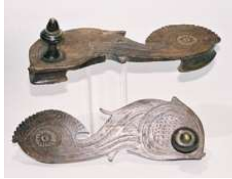
(لوحة ٢٤) بادوكا خشبية علي شكل سمكة تنسب إلي بنجلادش جنوب البنغال في منتصف القرن (١٣هـ / ١٩م) محفوظ بمتحف (shoes or no shoes)،