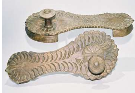
(لوحة ٣١) بادوكا خشبية تنسب إلى الهند، هيماشال براديش منتصف القرن (١٣هـ/١٩م)

محفوظ بمتحف (shoes or no shoes). رقم الحفظ 389