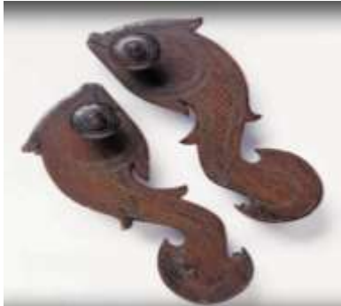
(لوحة ٢٣) بادوكا خشبية علي شكل سمكة مزخرفة بالنحاس تنسب إلى جنوب البنغال بالهند القرن (١٤هـ / ٢٠م) ، محفوظة في متحف باتا