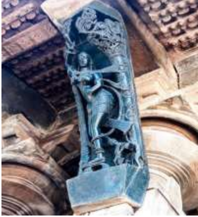
(لوحة ٣) منحوتة لإناث تسمى "مادانكا" في معبد رامابا ترتدي البادوكا

https://www.michaelbackmanltd.com/object/pair-of-carved-wooden-paduka-shoes