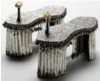
(لوحة ١٧) بادوكا إحتفالية مكفتة بصفائح من الفضة تنسب إلي الهند، على الأرجح راجستان، أو زنجبار، من (القرن ١٢هـ-١٣هـ / إلى ١٨م - ١٩م) محفوظة في متحف (Michael Backman Ltd). https://www.michaelbackmanltd.com/object/ceremonial-gold-silver-paduka-sandals/