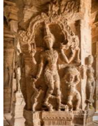
(لوحة ٤) تمثال تمثال شيفا وبارفاتي في معبد فيرابهادراعلي أحد الأعمدة في معبد فيرابادرا و تظهر بارفاتي ترتدي البادوكا

https://www.ritiriwaz.com/the-footwear-once-worn-by-men-and-women-in-india/