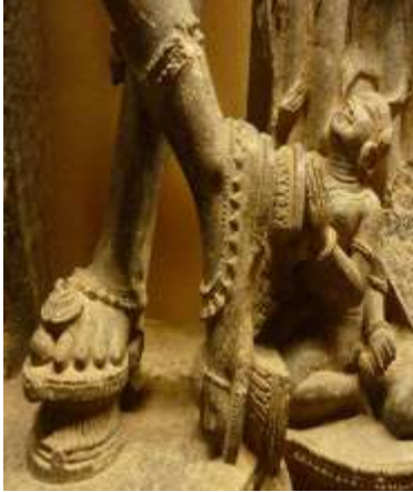
(لوحة ٥) تمثال يرتدي البادوكا محفوظ في متحف ولاية أوريسا

https://www.booksfact.com/history/origins-high-heels-platform-footwear.html