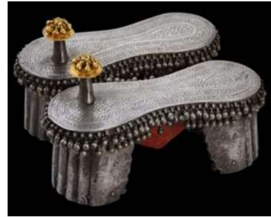
(لوحة ١٦) بادوكا أثرية من الفضة والذهب للزفاف يرجح نسبتها للهند من القرن (١٣هـ/ ١٩م) معروضة في متحف فيكتوريا وألبرت، لندن https://tvaraj.com/tag/footwear-2/