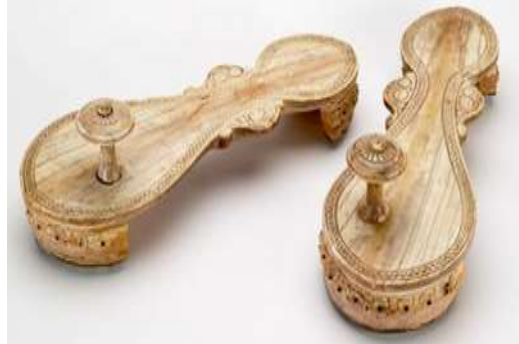
(لوحة ٢١) بادوكا من العاج تنسب للقرن (١١هـ / ١٧م) محفوظة في متحف باتا