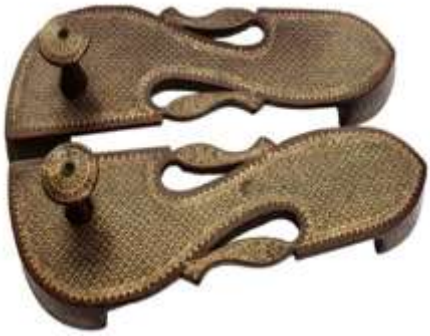
(لوحة ٢٥) زوج من البادوكا الخشبية ينسب إلي راجستان شمال غرب الهند أواخرالقرن (١٣هـ / ١٩م) أوائل القرن (١٤هـ / ٢٠م)

https://www.chiswickauctions.co.uk/auction/lot/lot-196--a-pair-of-brass-inlaid-toe-knob-wooden-paduka-sandals/?lot=123351&so=4&st=paduka&sto=0&au=&ef=&et=&ic=False&sd=1&pp=48&pn=1&g=1