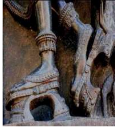
(لوحة ٢) تمثال يرتدي البادوكا في معبد رامابا

https://www.booksfact.com/history/origins-high-heels-platform-footwear.html