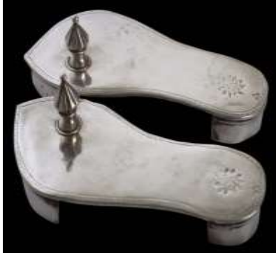
(لوحة ١٣) بادوكا مصنوعة من الفضة محفوظة في متحف (Michael Backman Ltd) تنسب إلي الهند، ربما ولاية غوجارات أواخر القرن (١٢هـ/١٨م)، وأوائل القرن (١٣هـ/١٩م)

https://www.michaelbackmanltd.com/object/pair-of-silver-paduka-sandals/