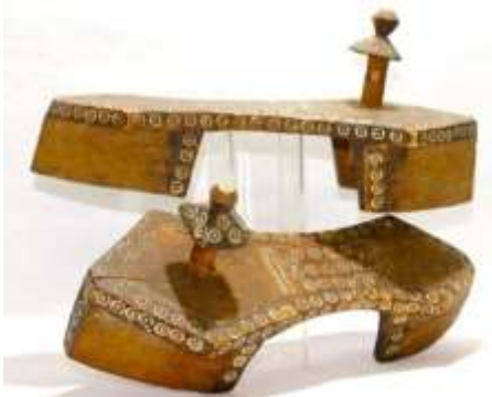
(لوحة ٢٩) بادوكا خشبية للسيدات ملونة تنسب إلي عمان أوائل القرن (١٤هـ / ٢٠م) محفوظ بمتحف (shoes or no shoes) رقم الحفظ ٣٣٩٨

https://www.michaelbackmanltd.com/archived_objects/hoshiapur-ivory-paduka-shoes/