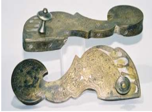
(لوحة ٢٠) بادوكا من معدن النحاس الأصفر والفضة و تنسب إلى باكستان لاهور منتصف القرن (١٣هـ / ١٩م) محفوظ بمتحف (shoes or no shoes) رقم الحفظ ٧٣١