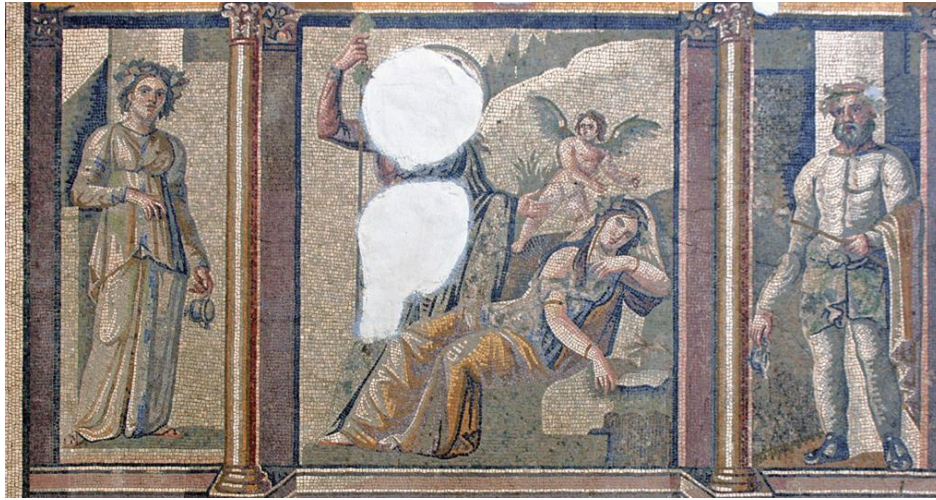
(لوحة ب) الجزء الأوسط