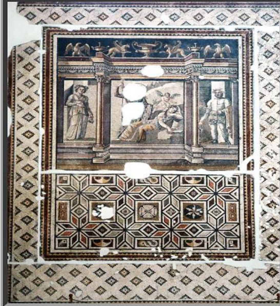
(لوحة ١) فسيفساء أنطاكيا

YAMAC, «Antakya Mozaikleri», 343-344, FIG.5.