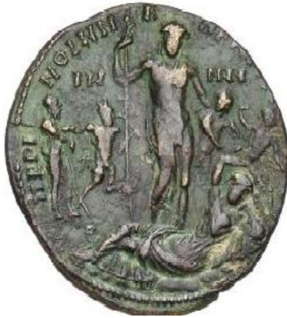
(لوحة ٤) عملة من بيرينثوس

SCHÖNERT, Die Münzprägung , 22, 239-240, TAV. 48, N. 779, 1.