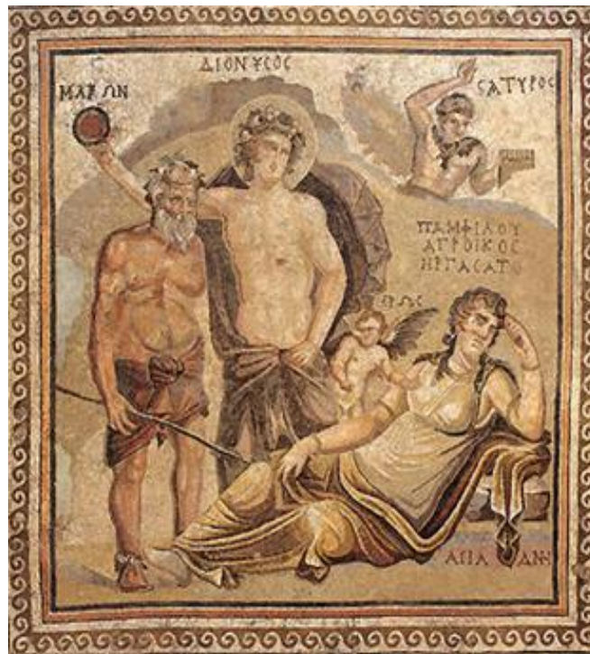
(لوحة ٥) فسيفساء شهبا

SCHÖNERT, Die Münzprägung , 22, 239-240, TAV. 48, N. 779, 1.