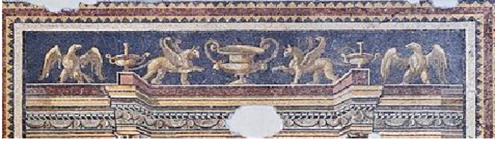
(لوحة أ) الجزء العلوي