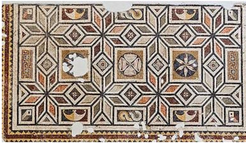
(لوحة ج) الجزء السفلي