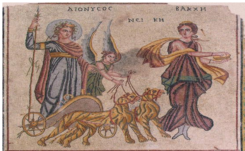
(لوحة ٨) فسيفساء زوجيما

PEDRAZ, «Historiografía De La Musivaria », 1074, FIG. 3.